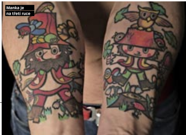
Manka je na třetí ruce

Žiju v Německu, kde mám i svého tatěra. Prvního čerta od Lady jsem si chtěl nechat udělat v Litvínově, ale ve studiu mě odmítli, protože bych jim prý dělal špatné jméno, až se svléknu na plovárně. To bylo